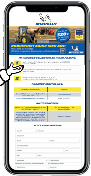
Abbildung und Inhalte ähnlich